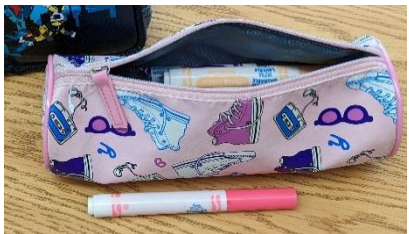
1 grand étui à crayons (trousse)