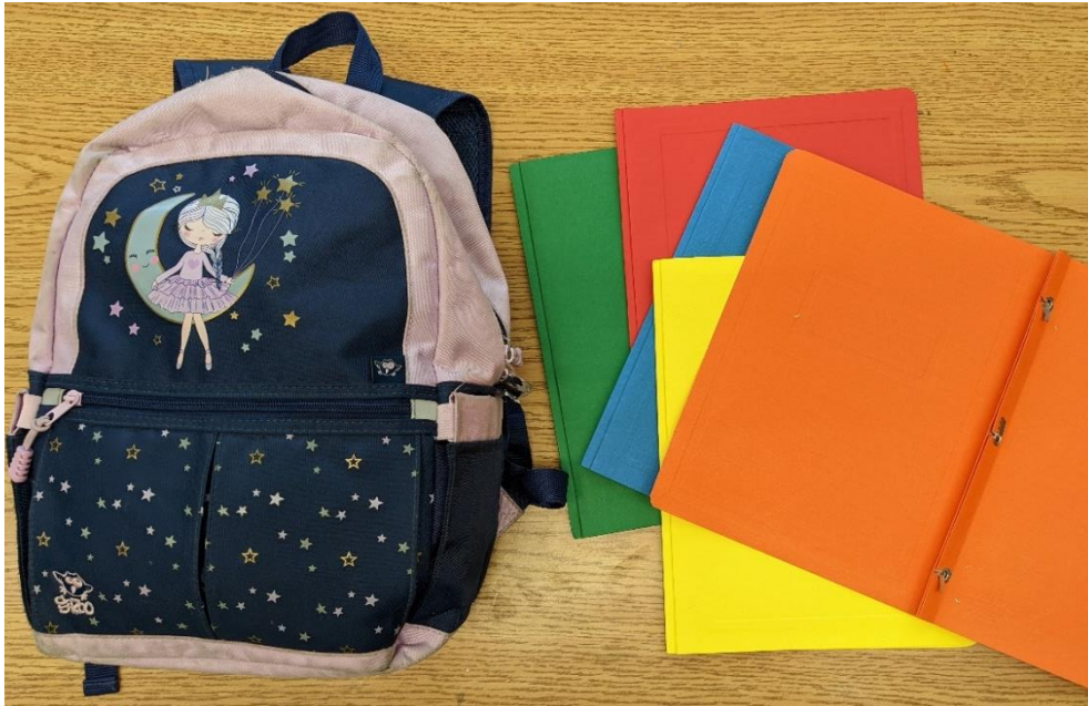
Sac à dos assez grand et duo-tangs (vert, rouge, bleu, jaune, orange) IDENTIFIÉS